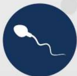
Semen Analysis (Basic Exam)