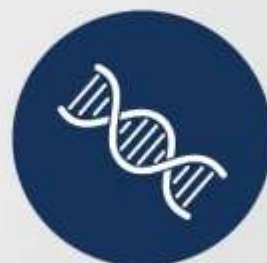
Semen Analysis (Advanced Exam)